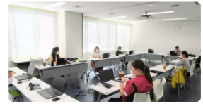
看護師認知症対応力向上研修 講師陣 (オンライン)

当院に近隣医療機関の看護師が集まり、認知症患者への介入事例の共有やグループワーク等の演習を実施し、認知症患者に対する理解を深めています。